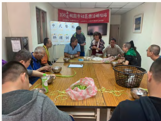
108年下半年 -樂活中餐課程