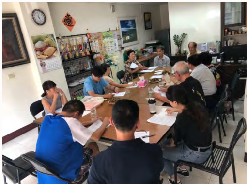
108年第十屆第11次 -理監事會議