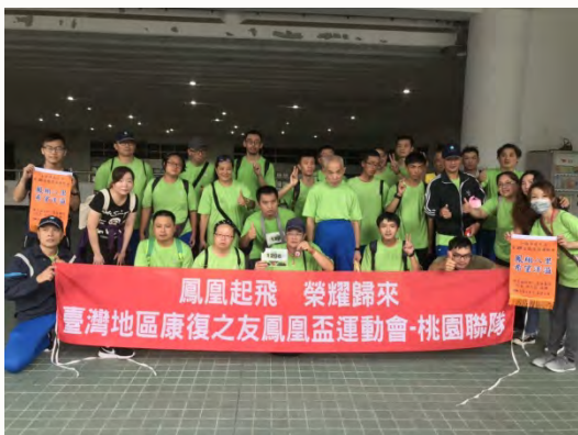
108年度 -鳳凰盃運動會