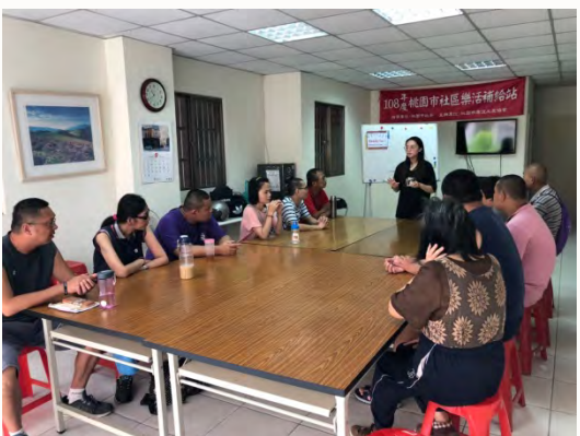
108年社工團體 -心智類障礙者自立 生活團體(工作篇)