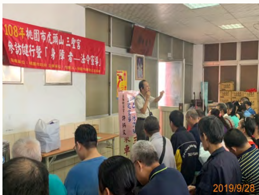
108年 -桃園市虎頭山三聖宮 參訪健行暨法令宣導