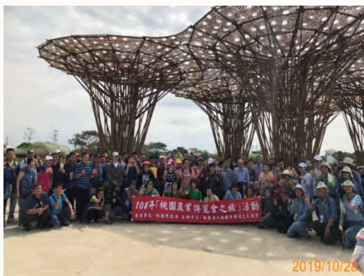
108年 -桃園農業博覽會之旅