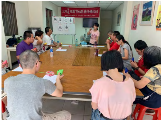
108年下半年 -樂活陶笛課程