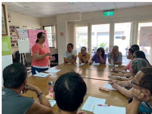
108年社工團體 -心智類障礙者自立 生活團體(工作篇)