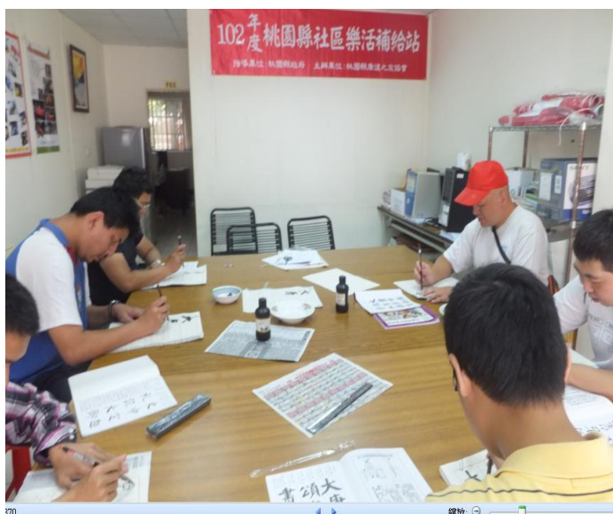
樂活書法班學員練得很專注