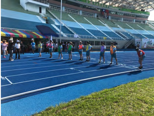
108年度桃園市 -康復之友馬拉松接力賽