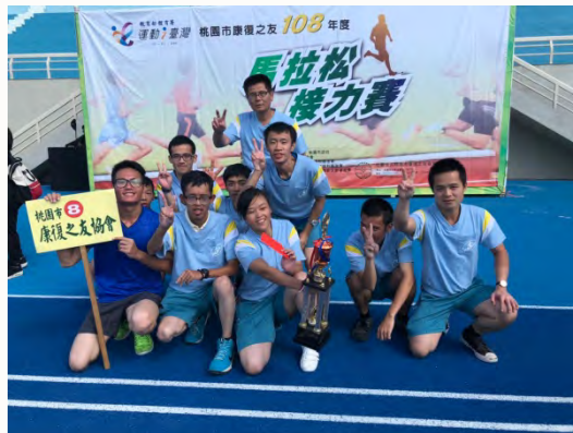
108年度桃園市 -康復之友馬拉松接力賽