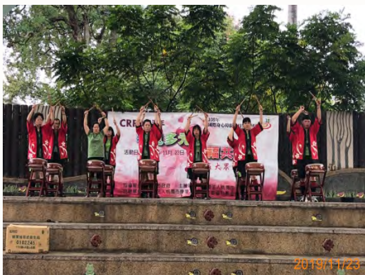
108年國際身心障礙者日 -「社區大眾同歡會」