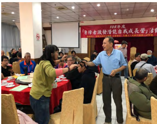
108年「身障者激發潛能自我成長營」