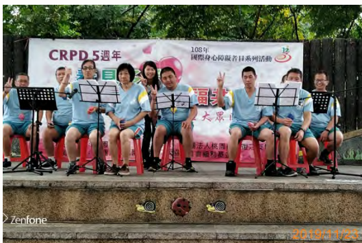
108年國際身心障礙者日 -「社區大眾同歡會」