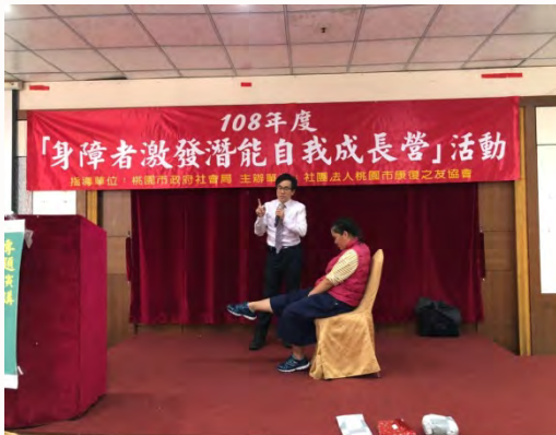
108年「身障者激發潛能自我成長營」