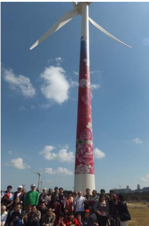
台電的彩繪風車好漂亮喔